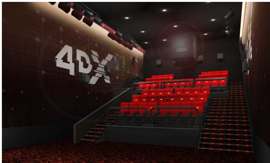
4DX シアター イメージパース