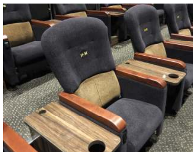
エグゼクティブ・シート イメージ

全国の 109 シネマズでご好評いただいているリクライニング機能と専用テーブルのついたエグゼクティブ・シートを劇場内のベストポジションに設置しています。「109 シネマズ大阪エキスポシティ」では、生地が厚めで柔らかさ、高級感の風合いがあるモツエスポア生地を採用しています。