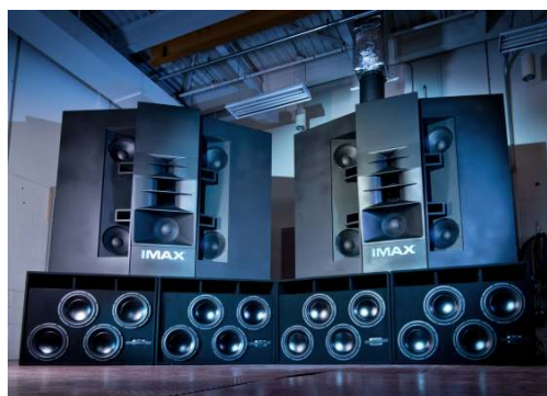
サウンドスピーカー