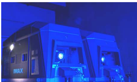
4K ツインレーザープロジェクター

日本で初めてIMAX®を導入（「109シネマズ大阪エキスポシティ」で9サイト目）した109シネマズとIMAX社のコラボレーションが、誰も見たことのない最高の映画体験をお届けします。