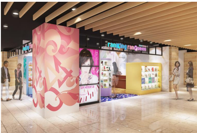
本店舗イメージパース