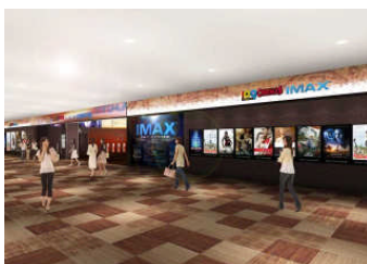
エントランスイメージ