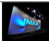
デュアル・プロジェクター・システム

2台のプロジェクターによって投影されるクリアで明るい映像と、パワフルなデジタル・サウンド、劇場に合わせたシアター設計によって、観客の視野を最大限に高め、まるで映画の中にいるような臨場感溢れる映像体験が可能です。